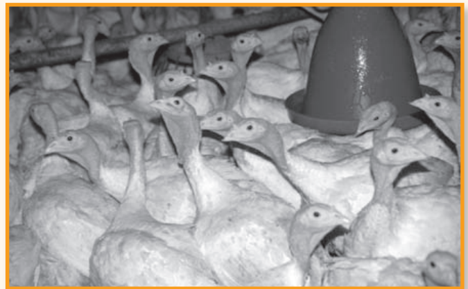
..qualvolle Zeit. Das darf nicht sein!