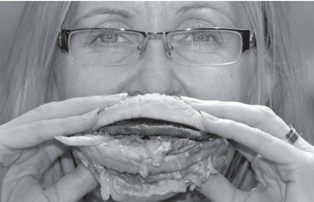
Burger essen: Nicht nur in Burgern ist Fleisch aus der industriellen Tiermast

direkte Nahrungskonkurrenz zum Menschen. Um 6 Milliarden Menschen zu ernähren leben 20 Milliarden „Nutztiere“ auf unserem Globus. Mit verheerenden Folgen und einer steigenden Tendenz. Alleine jedes der 1,3 Milliarden Rinder hinterlässt eine Spur der Verwüstung schreibt Franz Alt in seinem Buch „Agrarwende jetzt“. Demnach werden für ein Rind 18.000 Quadratmeter Regenwald in Weideland umgewandelt, über 25% des Regenwaldes gingen unwiederbringlich verloren. Die Erzeugung des Futters für dasselbe Tier verbraucht 600.000 Liter Wasser. Im regensicheren Deutschland keine große Menge, im überwiegenden Rest der Welt schon. Die Abgase eines Rindes sind auch nicht zu unterschätzen. 200.000 Liter Methangas rülpst ein Rind im Laufe eines Lebens in die Umwelt. Methan ist 20-mal so klimaschädlich wie Kohlendioxid. Unser Fleischkonsum verursacht heute schon mehr Treibhausgase als der Autoverkehr.