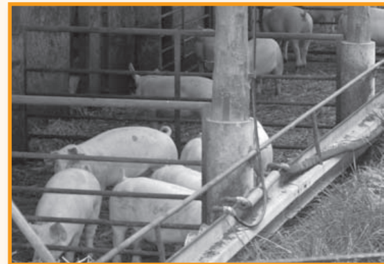
Bei Neuland haben die Schweine Auslauf – nur so geht es