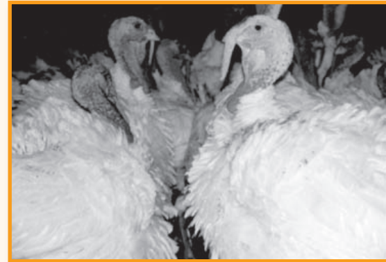
Mastputen: Zu Lebzeiten und beim Sterben dauerndes Leiden

werden können. Neuland-Fleisch oder Bio (was nicht unbedingt eine gute Tierhaltung bedeutet) hätten echte Chancen sich auf dem Markt durchzusetzen. Wir würden für unseren Lebensquell Nahrungsmittel, das bezahlen, was er wert ist.