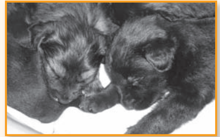
„Welpenalarm“... in unserem Tierheim

A m 11. März wurden im Tierheim 13 Welpen geboren. Das Muttertier wurde in Weilerswist ausgesetzt und war stark abgemagert als sie zu uns kam. Sie ist zwar etwas scheu aber ausgesprochen lieb. Trotz allen medizinischen und Pflegeeinsatzes, überlebten leider fünf kleine Welpen nicht. Von ihnen haben 8 bis jetzt überlebt. Wie werden diese Hunde einmal aussehen,