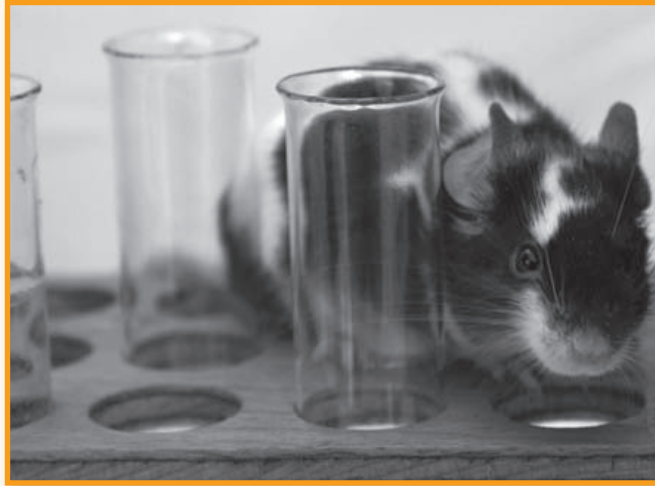
Tierversuche für Kosmetikprodukte sind unnötig

suche eingestellt werden, wenn die Hersteller auf die bereits existierenden mindestens 8.000 Rohstoffe zurückgreifen würden. Aber auch für Firmen, die auf neue Kosmetikprodukte setzen, gäbe es eine Alternative. Für alle gängigen, im