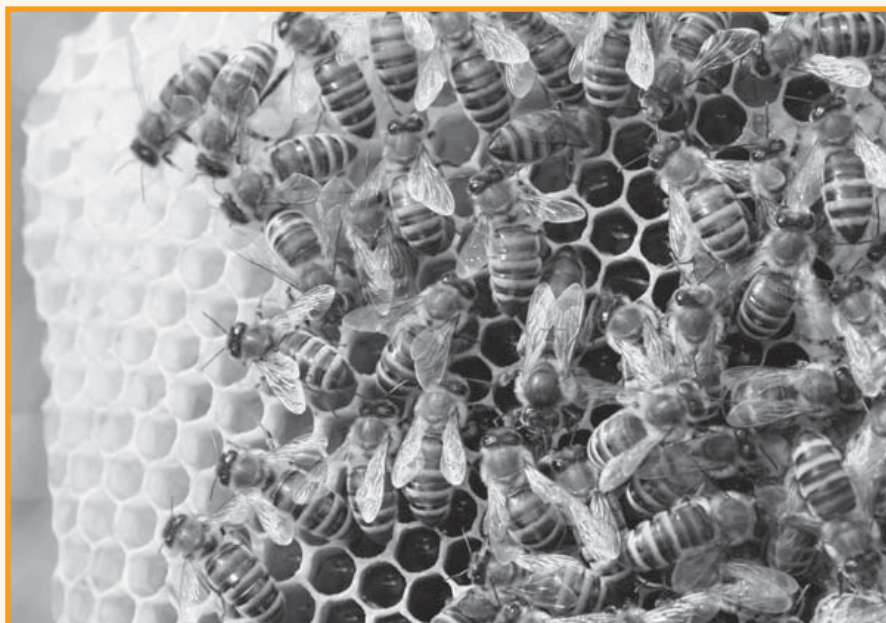
Die Bienenkönigin (Mitte) sichert das Fortbestehen des Volkes

Wie es auch summt und brummt, ohne die Schlüsselspezies Bienen kommt unsere Nahrungsproduktion wirklich nicht aus.