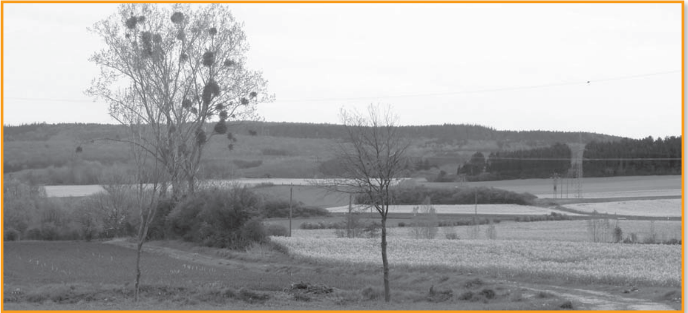
Wenn es schlecht ausgeht, steht hier einmal eine Putenmastanlage

B ei der Ernährung schauen die Menschen zunehmend auf ihre Gesundheit. Kalorienarm aber schmackhaft soll es sein. Nach vielen Fleischskandalen rückt zunehmend das Putenfleisch, auch als Alternative zu Hähnchen, in den Blickwinkel der Verbraucher. Als Konsequenz der steigenden Nachfrage müssen immer neue Ställe entstehen, nun auch in direkter Nähe zu Mechernich. Dabei trägt der Eindruck, dass es sich bei Puten um durchweg gesunde Tiere handelt. Im