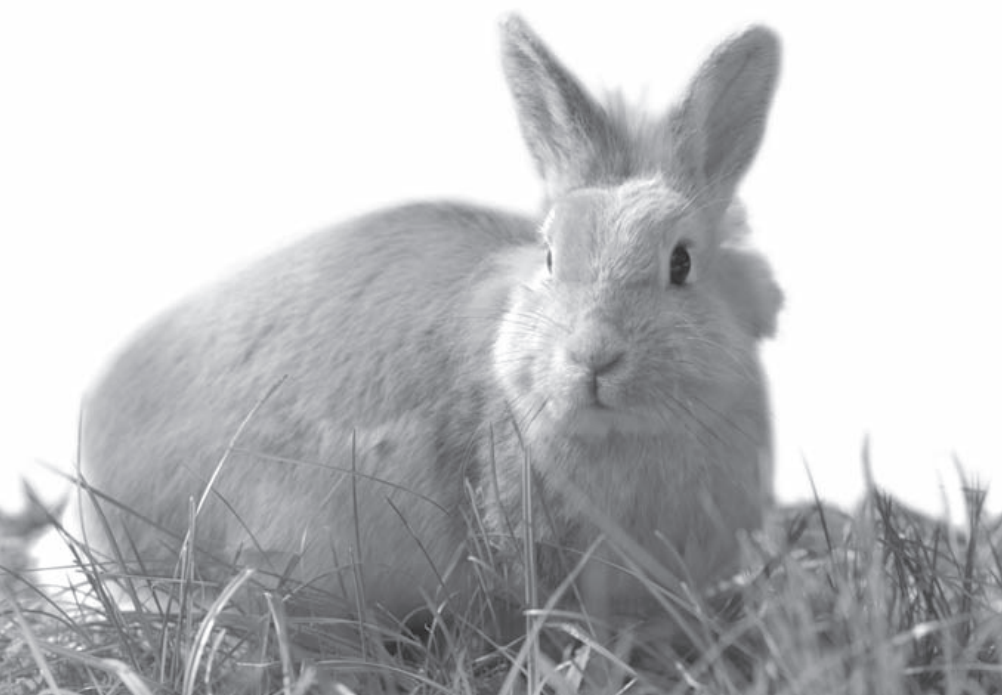
Mir geht es gut! Ich erleide keine Tierversuche

Seit 1998 sind Tierversuche in Deutschland für die Entwicklung von Kosmetika verboten. 2004 folgte innerhalb der EU der erste kleine Teilerfolg, als Tierversuche für die Prüfung fertiger kosmetischer Artikel verboten wurden. Im Jahre 2009 wurden dann von der EU Tierversuche für neue kosmetische Inhaltsstoffe abgeschafft. Auch fertige Kosmetika aus Drittländern, die in Tierversuchen getestet wurden, dürfen ab diesem Zeitpunkt nicht mehr in der EU vermarktet werden.