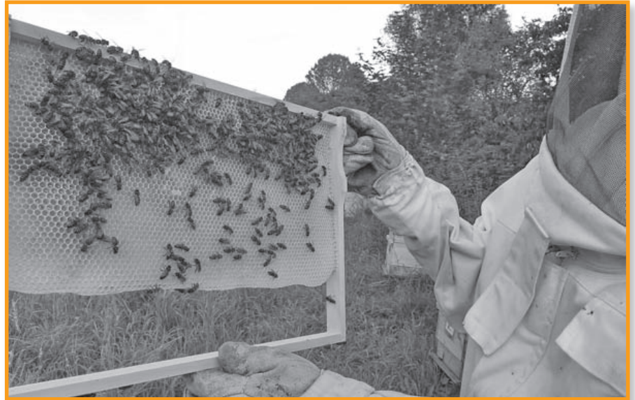
Ein Imker bei der Arbeit mit seinem Bienenvolk

Insekten anzulocken. Die Nektar und Pollen sammelnde Biene wurde „im Gegenzug“ zu einem perfekten Pollenüberträger. Sie