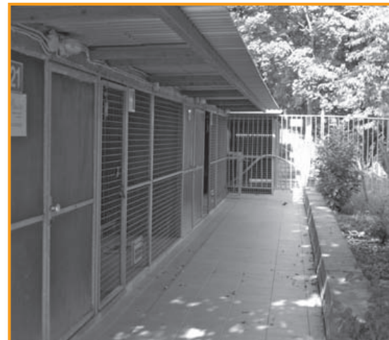
Unser Katzen- und Hundehaus

die Kapazitäten dafür ausreichen würden, wozu auch die Anstellung des Fachpersonals gehört. Kapazitäten für eine artgerechte Unterbringung der Tiere, auch im Sinn der Besitzer, hängen jedoch von der entsprechenden finanziellen Ausstattung ab. Mit Spenden ist das nicht zu machen.