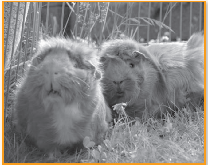
Auslauf ist auch für Meerschweinschen das Größte

chens ein Leben lang. Deswegen ist es wichtig, ausreichend Nagematerial wie Heu, Äste und Rinden anzubieten, damit sich die Zähne abreiben. Hartes Brot reicht hierfür nicht aus. Körnerfutter muss bei normalgewichtigen und nicht tragenden Meerschweinchen in Innenhaltung nicht gegeben werden, eine tägliche Grünfütteration ist hingegen wichtig. Werden die Zähne nicht genügend abgerieben, wachsen sie spitz in den Mund hinein und verursachen Schmerzen und Verletzungen an Zunge, Lippe und Zahnfleisch. Oft sind zu lange Zähne die Ursache für Gewichtsverlust und schlechte Nahrungsaufnahme bei Meerschweinchen: sie können deswegen sogar bei gefülltem Futternapf verhungern! Wichtig ist deswegen eine regelmäßige, am besten vierteljährliche, Zahnkontrolle durch den Tierarzt. Spätestens jedoch bei