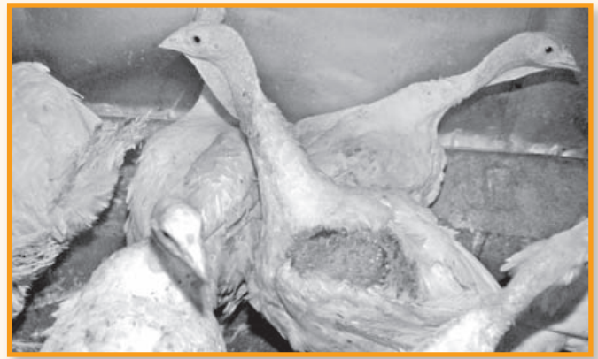
Mastputen haben eine...

um den Schutz ihrer eigenen Gesundheit und der Werthaltigkeit ihres Eigentums. Mit dem Änderungsansatz des Bebauungsplanes jedoch haben die Mechernicher schon wesentlich mehr getan, als viele andere Kommunen in NRW. Am Ende kann es uns allen nur darum gehen. Keine industrielle Massentierhaltung in Mechernich oder anderswo! Das sich (fast) jeder auch in seinem Verhalten als Fleischesser prüfen ist, versteht sich von alleine.